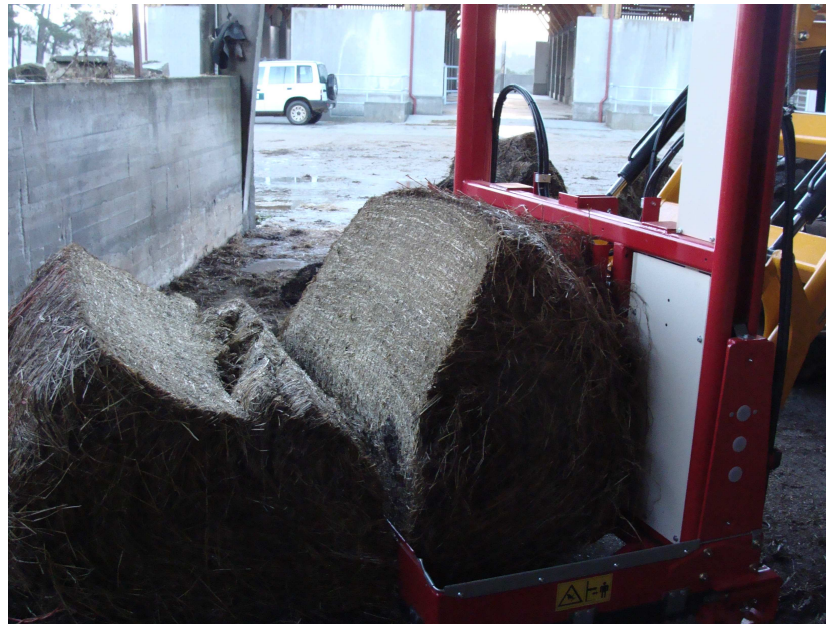
Corte dunha rotopaca de fenolaxe

A produción de pasto non é estábel ó longo de todo o ano senón que ten un forte pico na primavera e outro máis suave no outono con baixas ou incluso nulas producións nas partes centrais do verán e do inverno. No referente ás necesidades alimenticias dos nosos rabaños dependerá da época escollida para a parideira e anque tratemos de facer coincidir esta ca primavera en moitos casos estamos "obrigados" pola demanda de anos a ter partos no verán, e como non, tamén de cara ó Nadal. Nestes caso é cando o alimento conservado xoga un papel fundamental á hora de reducir custes, pois de canta mellor calidade sexa máis enerxía e proteína lle aportarán ó gando e seremos menos dependentes de alimentos conservados co conseguinte aforro que esto supón.