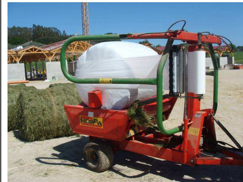
Encintado dunha rotopaca

Este proceso conleva, en maior ou menor medida, unha perda apreciable do valor proteico do alimento, causada polas chamadas "reaccións de caramelización" onde se producen compostos nitroxenados indixestíbeis para o animal. As pacas de fenolaxe unha vez abertas deben consumirse con rapidez, en dous días como máximo, polo que o tamaño das pacas debe adecuarse ás necesidades do rabaño que temos que alimentar.