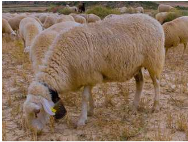
Ovella Navarra

Destacar, por outro lado, que no campo da reprodución a Ovella Navarra é de ciclo ovárico continuo, o que permite intensificar o proceso reproductivo diminuíndo o intervalo entre partos. Na actualidade está moi xeneralizado o sistema de tres partos en dous anos sen o uso de tratamentos hormonais.