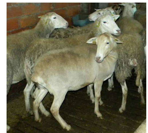
Ovella da raza Pelibuey

Estamos nun momento crítico e o sector no resto de España está moi ben organizado, falta principalmente en Galicia organizar as vendas para poder defendernos mellor. Sería moi importante ter una denominación de calidade.