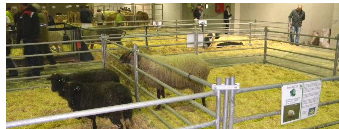
Ovellas galegas e macho da raza Latxa

Según datos do Pazo de Feiras e Congresos de Lugo, a asistencia foi de preto de 16.000 persoas ó longo dos 3 días de actividades.