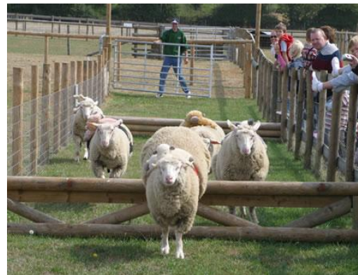
Carreira de peluches sobre ovellas.