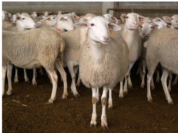
Ovellas Salz

A súa creación produciuse o longo do período 1973-80 a partires de cruzamentos entre ovelas de Rasa Aragonesa e sementais Romanov. O esquema foi dirixido co fin de obter animais de alto rendemento reproductivo (en termos de precocidade sexual, desestacionalización e prolificidade), capacidade de adaptación ás zonas de explotación ovina da rexión e características de canal e carne que responderan ás esixencias do mercado tradicional de Ternasco de Aragón.