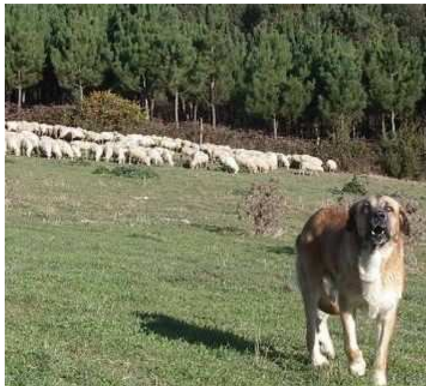
Protección do rabaño con mastíns