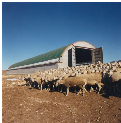
Nave prefabricada para explotacións de ovino.

Solicitáronse axudas para participar ó igual que nos anos anteriores na feira Semana Verde de Galicia (Silleda) con diversas actividades.